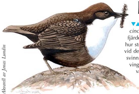
Illustration av Jonas Lundin

▼ Mer information? Vill du veta mer, besök gärna projektets hemsida via www.x.lst.se .