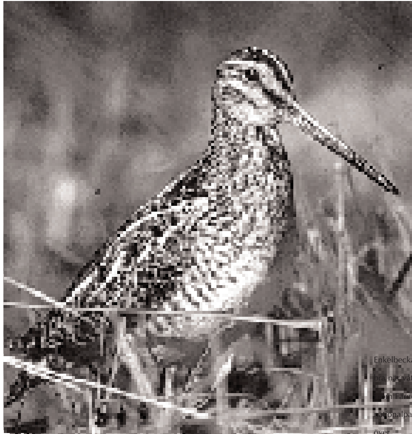
Enkelbeckasinen trivs på näs-våtmarkerna i Färnebofjärdens nationalpark svämmas över.