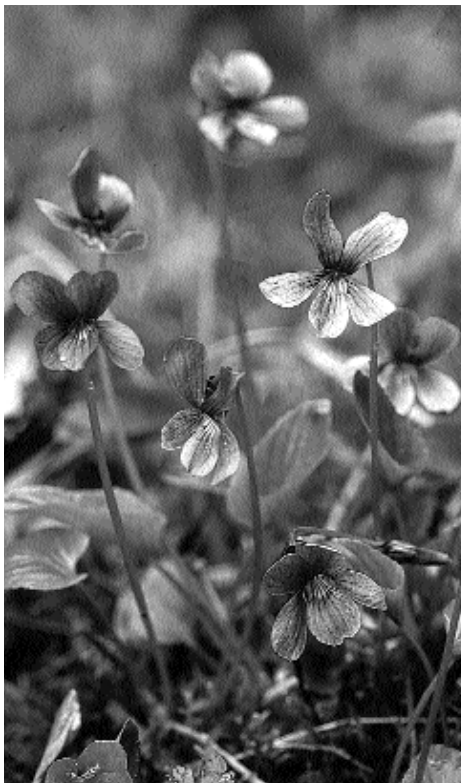
I nationalparken kan man finna den ovanliga sump-violen. På grund av sin relativt rikliga förekomst runt Färnebofjärden kallas den även Dalälvsviol.