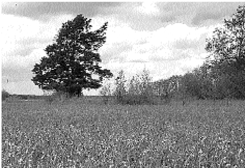
De flacka älvängarna, som domineras av starr- och gräsarter, är karaktäristiska för Färnebofjärden.

De som varit ute och fiskat har också märkt att de ställen som fungerar bra på sommaren i vanliga fall inte varit de bästa i år. Men det finns också de som gynnas av alla vattengölar, exempelvis mygg, trollsländor och grodor.