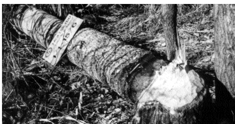
Kan inte bävern läsa? En asp med informations-skylt om fågelskyddsområde har fällt av en bäver...

Svämaspskogar. Den grova aspskog som finns runt Färnebofjärden saknar motsvarighet i Sverige. Läs mer om de unika aspskogarna, bävrarna och den vittryggiga hackspetten på baksidan.