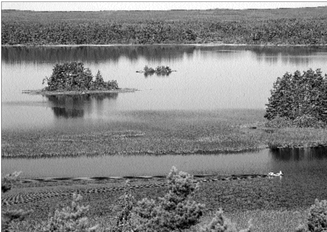
Utsikt över Färnebofjärden från fågeltornet i Skekarsbo.

▼▲▼ Vid den rovdjursinventering som gjordes i mars i år påträffades inga säkra spår av lodjur eller andra rovdjur inom parken.