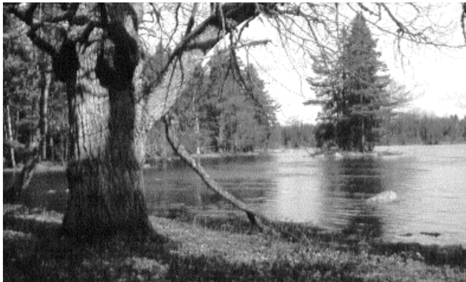
Dalälven vid Sevedskvarn, inte långt från den plats där HM Konungen för drygt ett år sedan invigde Färnebofjärdens nationalpark.

Det finns tecken på en ökning av både förekomsten och naturpåverkans storlek. Många bävrar i området för ett kringflackande liv, vilket kan vara ett tecken på att de är unga och inte har hunnit bygga en egen hydda.