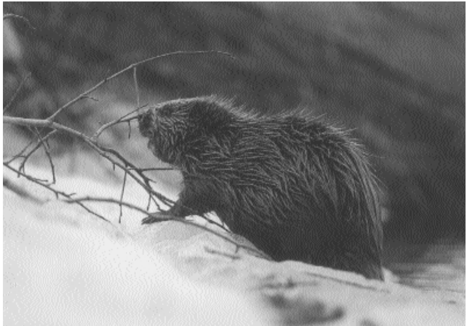
Bäverstammen ökar inom Färnebofjärdens nationalpark. På sikt kan det bli ett problem för vissa hotade arter.